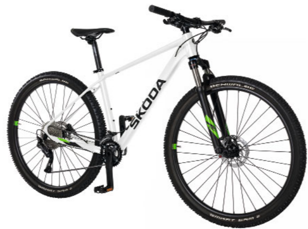
„Škoda MTB“ dviratis

Rėmas: 18,0 colių (M) Rėmas: 20,0 colių (L) 000 050 212CG 000 050 212CH