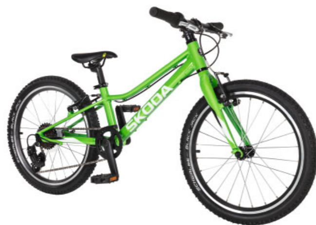
„Škoda Kid“ dviratis