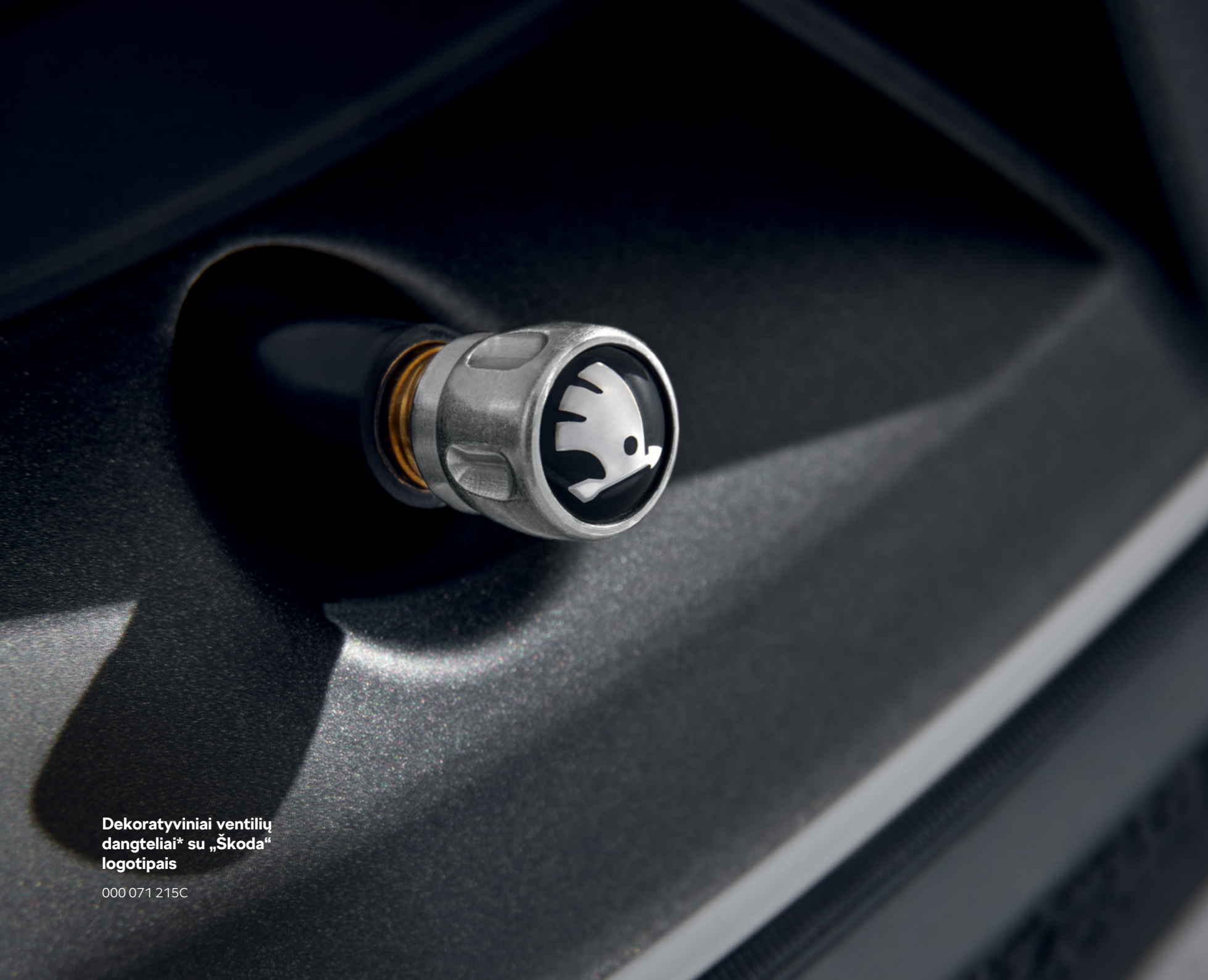
Dekoratyviniai ventilių dangteliai* su „Škoda“ logotipais