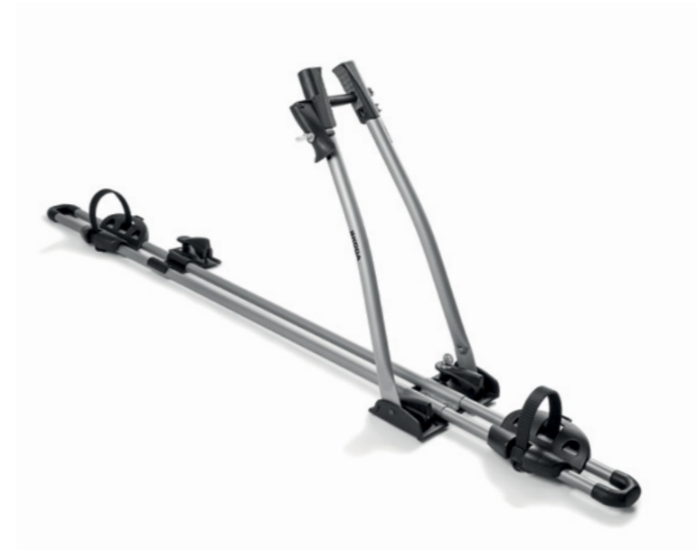
Nerūdijančio plieno rakinamas dviračių laikiklis