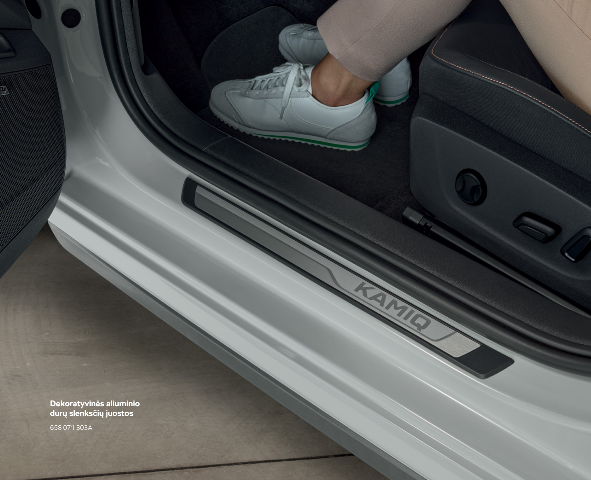
Dekoratyvines aliuminio duru slenksciu juostos