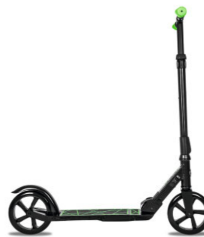
Sulankstomas paspirtukas „EVO“