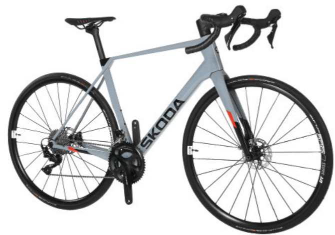
„Škoda Road“ dviratis