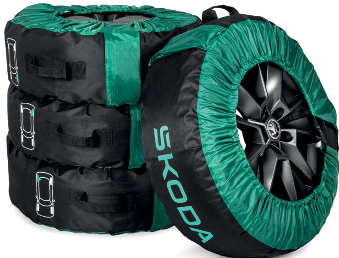
Užvalkalai visam ratų komplektui

Automobilio ratai yra kaip batai. Nesvarbu, ar Jūsų Škoda „batai“ yra stilingi, sportiški ar tiesiog funkcionalus, mūsų siūloma daugybė ratų priedų padarys Jūsų ratus dar patrauklesnius ir visiškai unikalius!