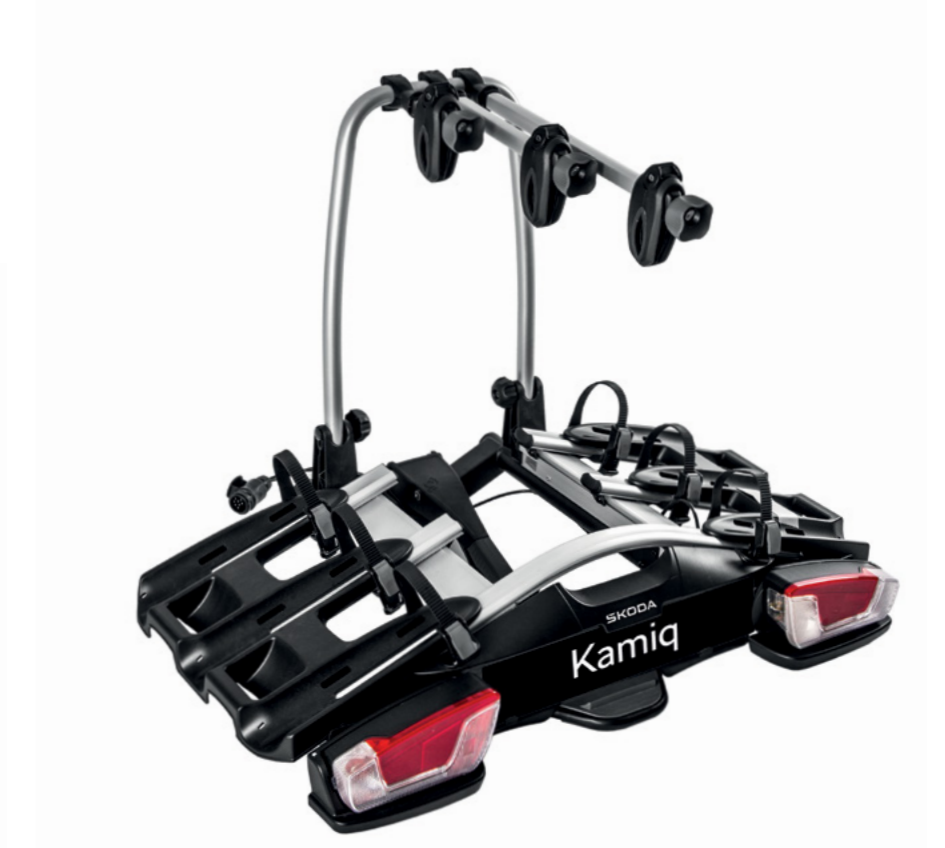
Dviračių laikiklis 3 dviračiams

000 071 105P | Skirta eismui kairėje pusėje