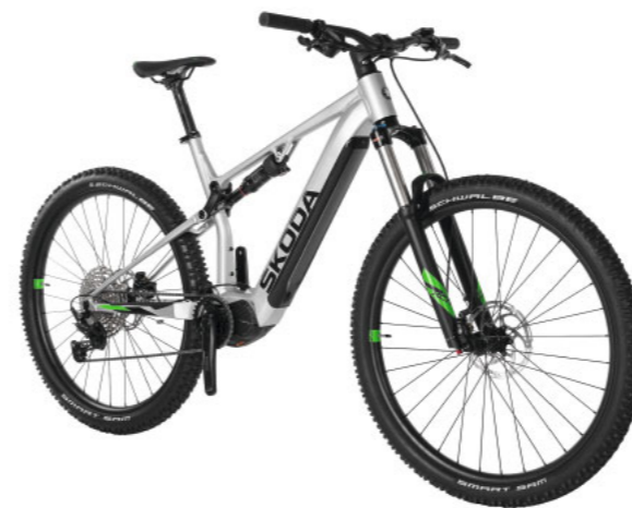
„Škoda eMTB“ dviratis

Rėmas: 18,0 colių (M) Rėmas: 20,0 colių (L) 000 050 212CG 000 050 212CH