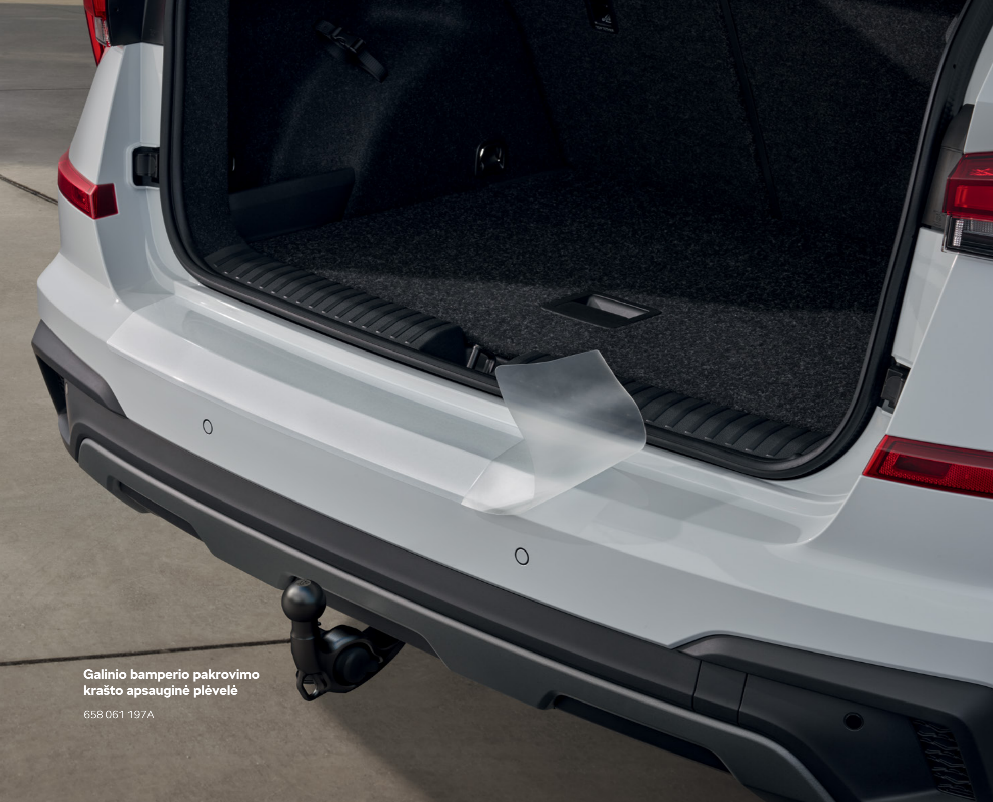
Galinio bamperio pakrovimo krašto apsauginė plėvelė