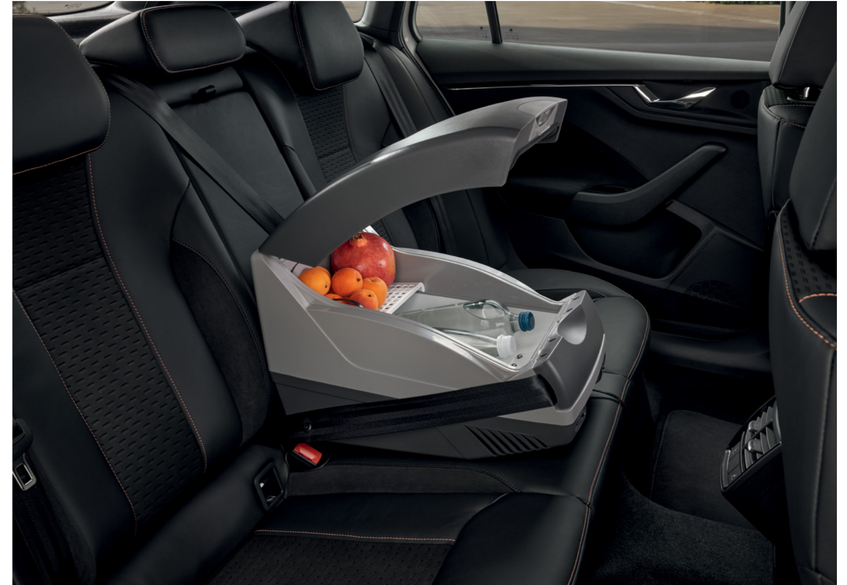
20 l termoizolacičné elektra šaldanti daiktadėžė