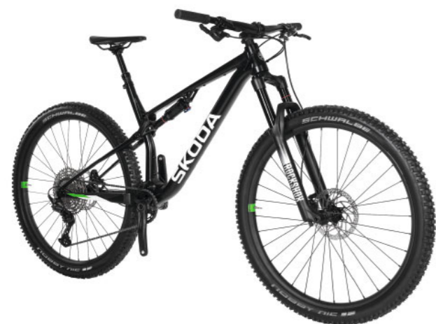
„Škoda MTB+“ dviratis