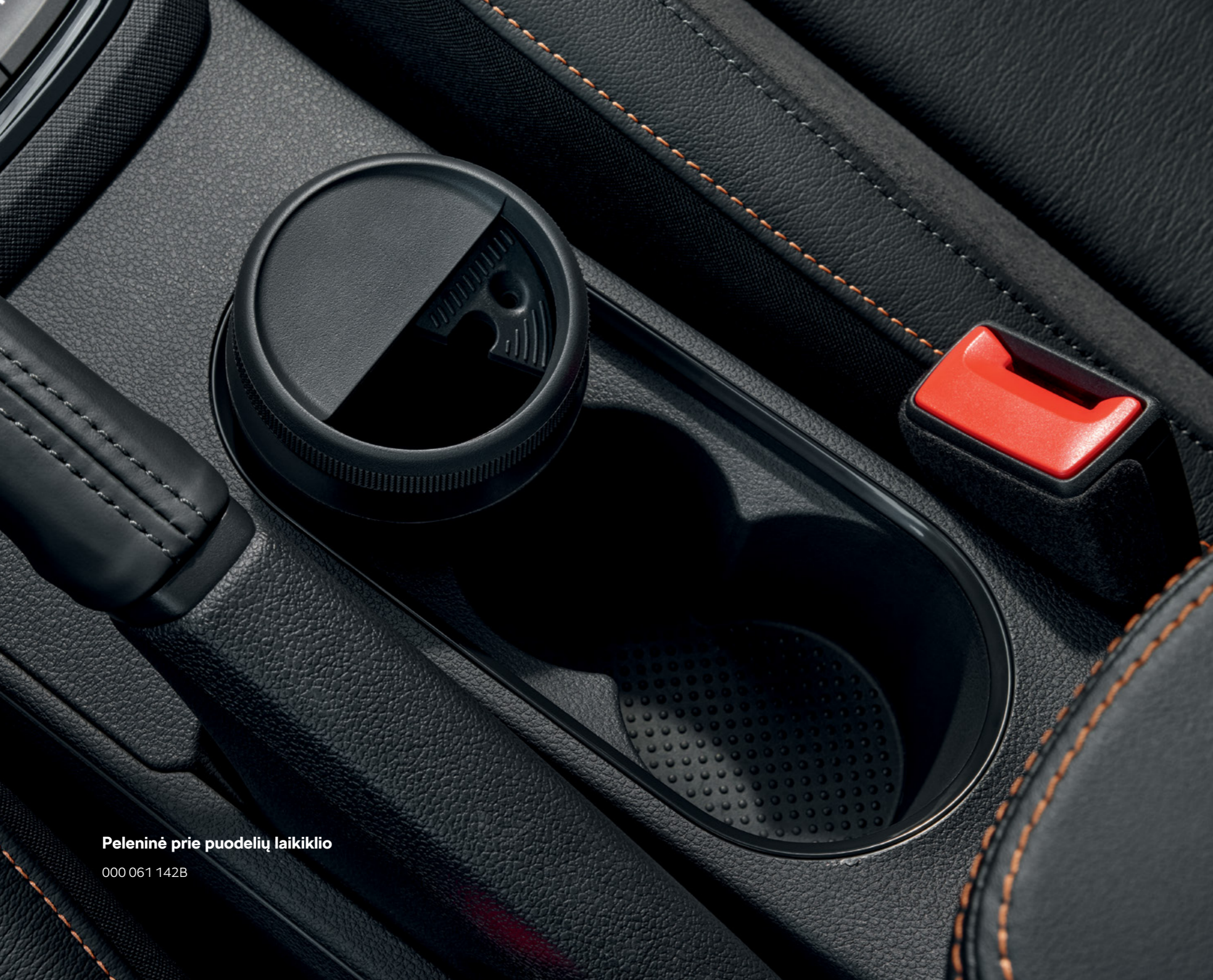
Peleninė prie puodelių laikiklio