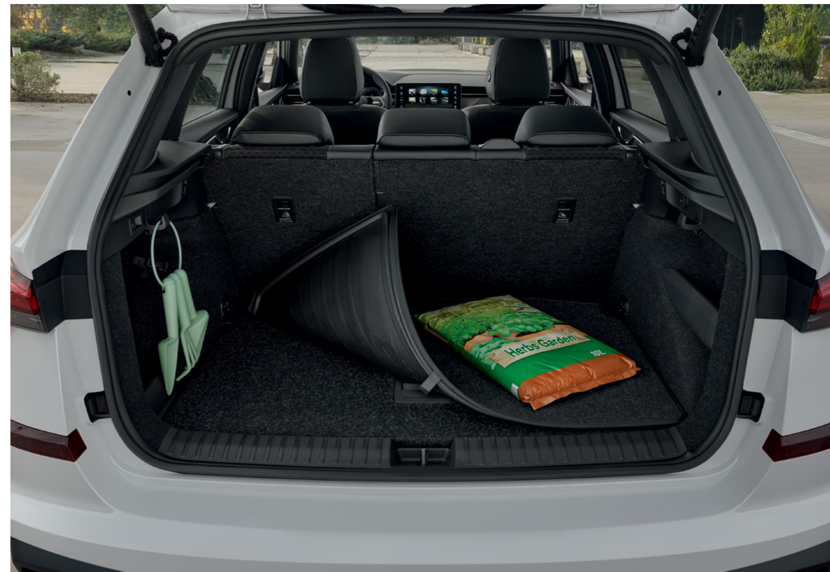
Dvipusis sulankstomas bagažinės kilimėlis