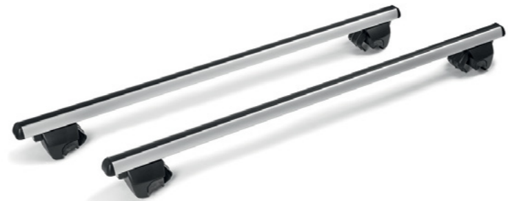
Skersiniai stogo bagažinei tvirtinti