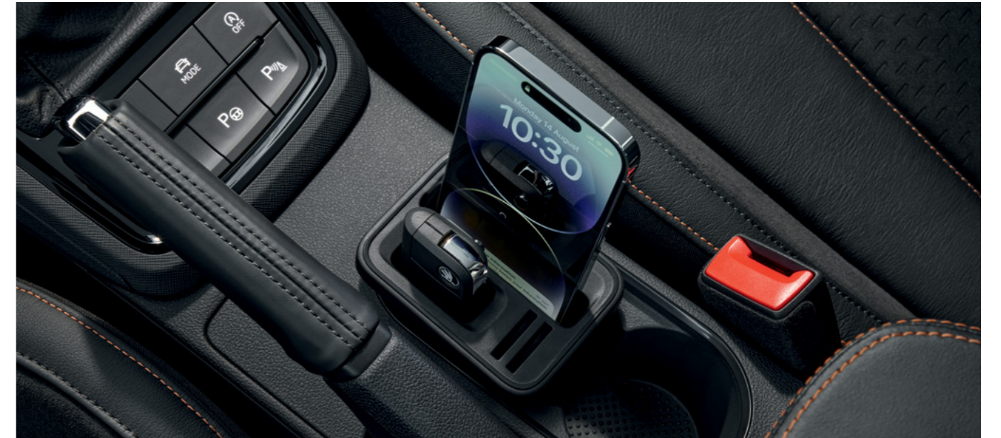
Adapteris porankio apačioje