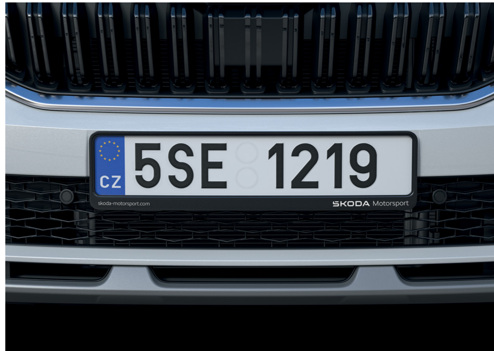
Valstybinio numerio rėmelis