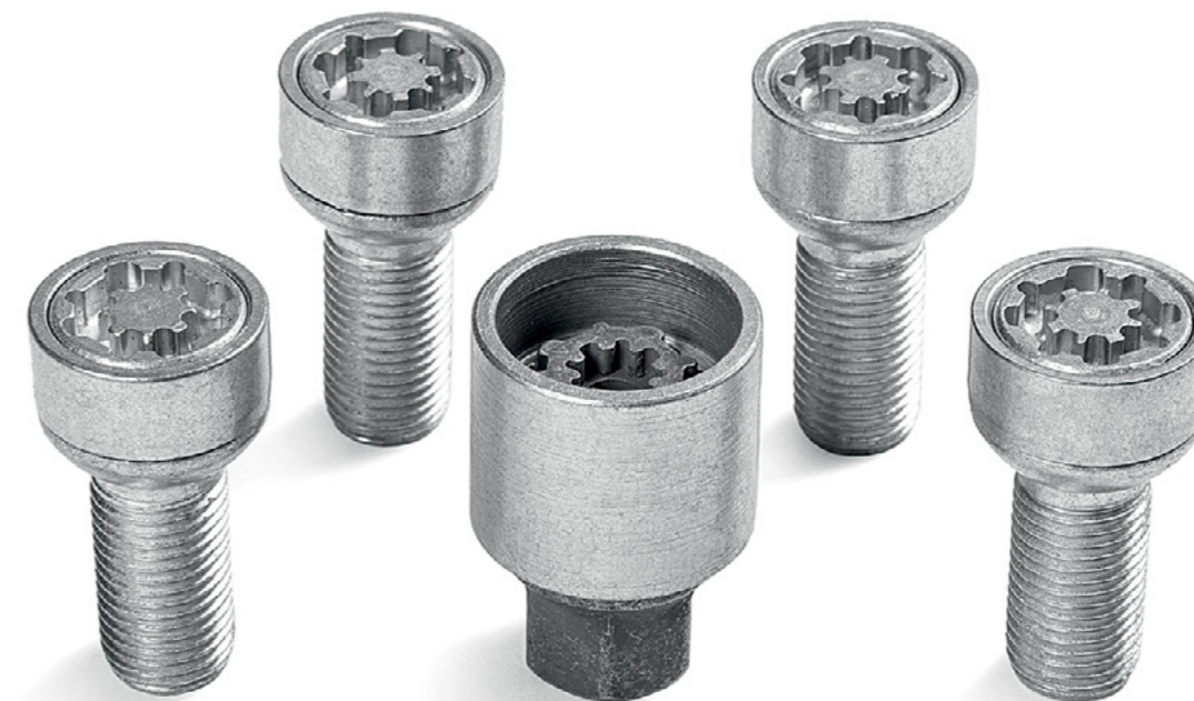
Ratų fiksavimo varžtai