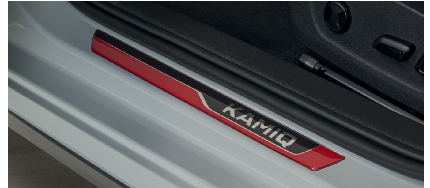
Dekoratyvines vario 3D duru slenksciu plėvelės