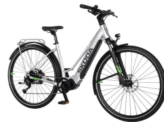
„Škoda eCross“ dviratis