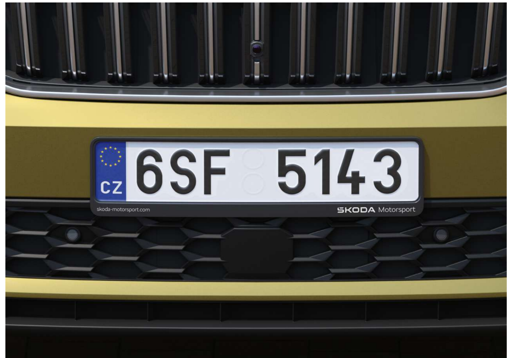
Valstybinio numerio rėmelis