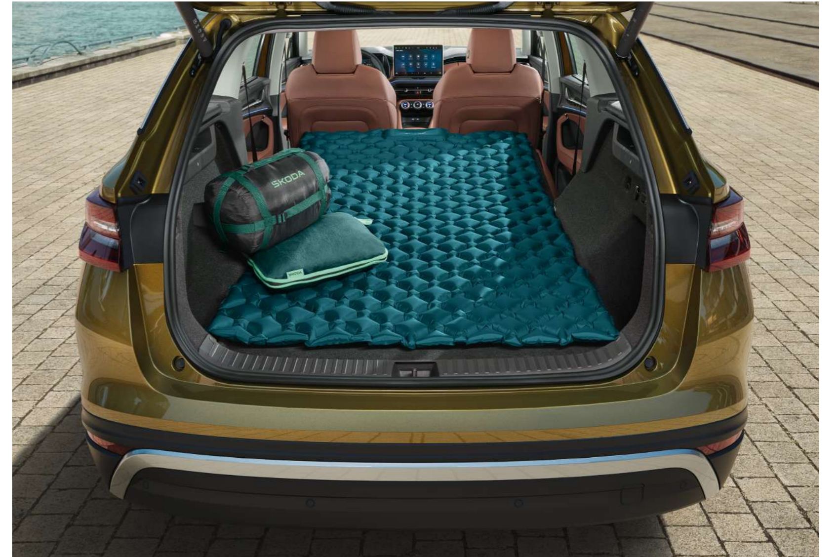
Bagāžinēs erdvēs kompensācinis elements / paruošimas miegui