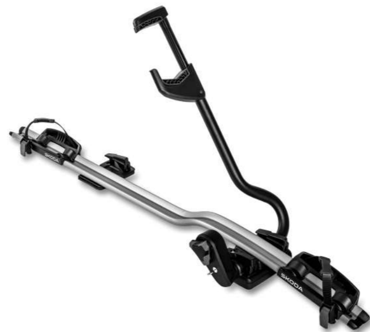
Dviračių laikiklis – aliuminis