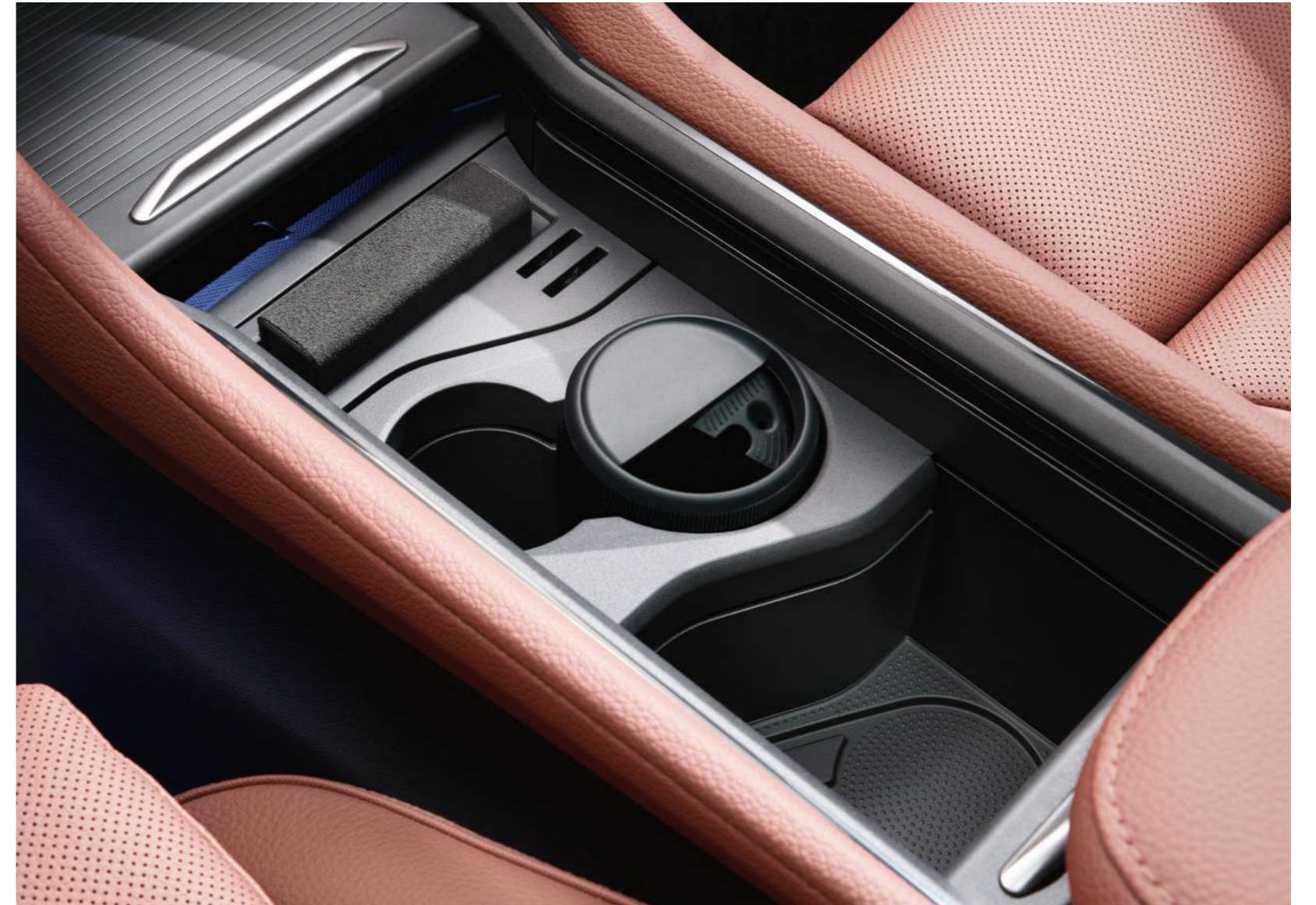
Peleninės pakeitimas į puodelio laikiklį