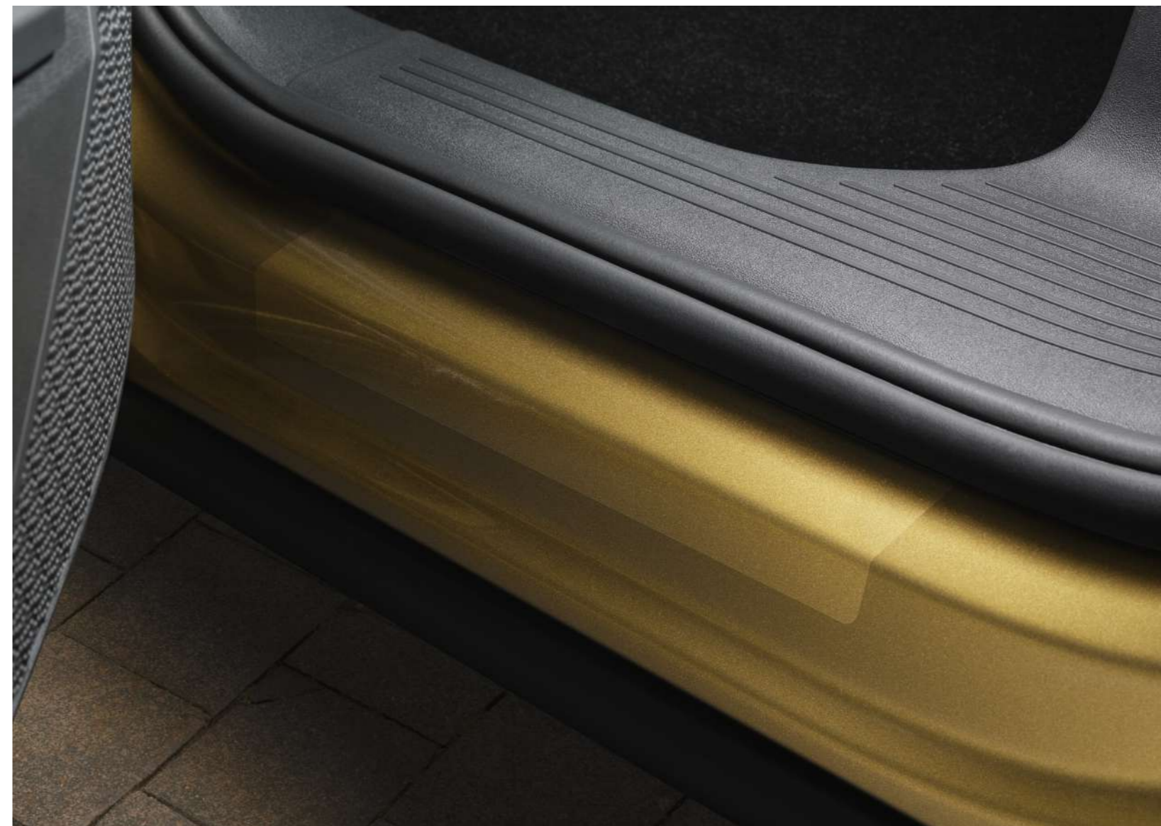
Galinių durų slenksčių apsauginės plėvelės – skaidrios