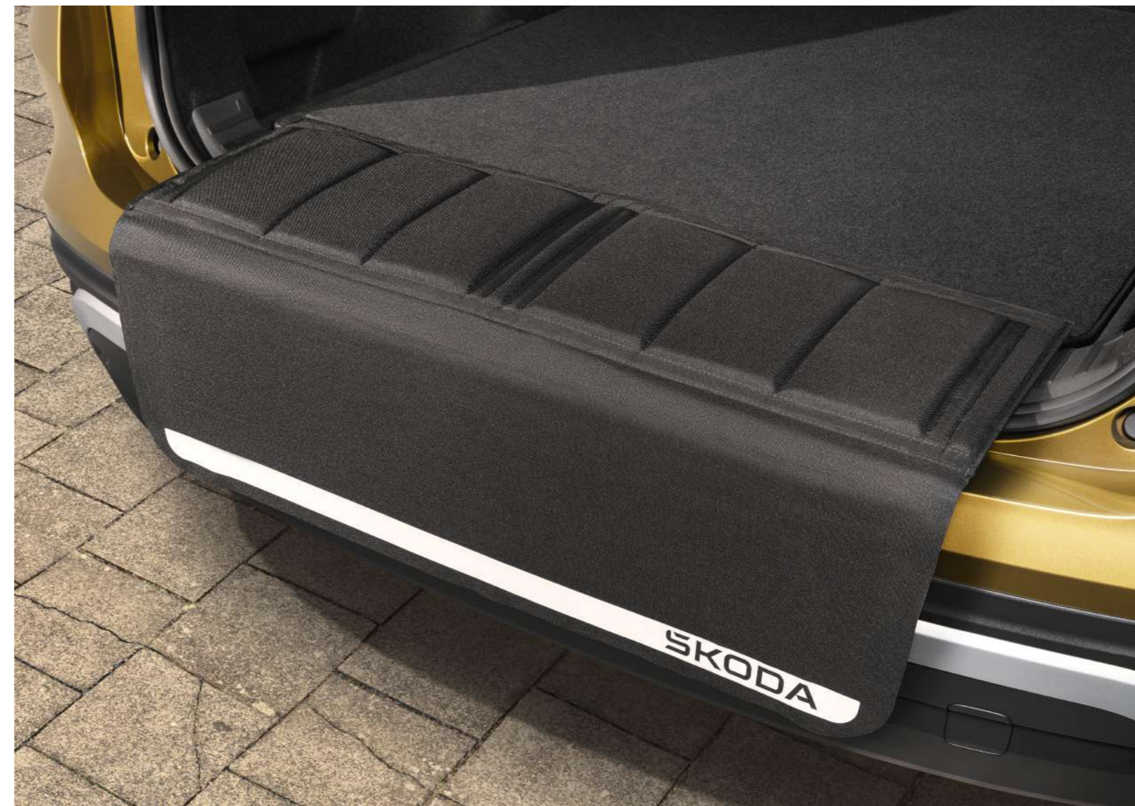
Galinio bamperio pakrovimo krašto apsauginė plėvelė