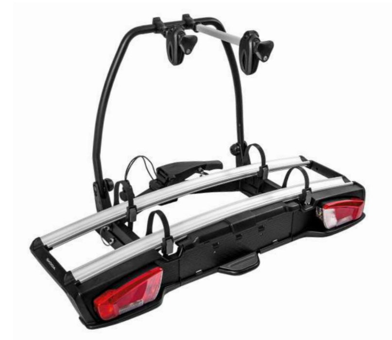
Dviračių laikiklis 2 dviračiams