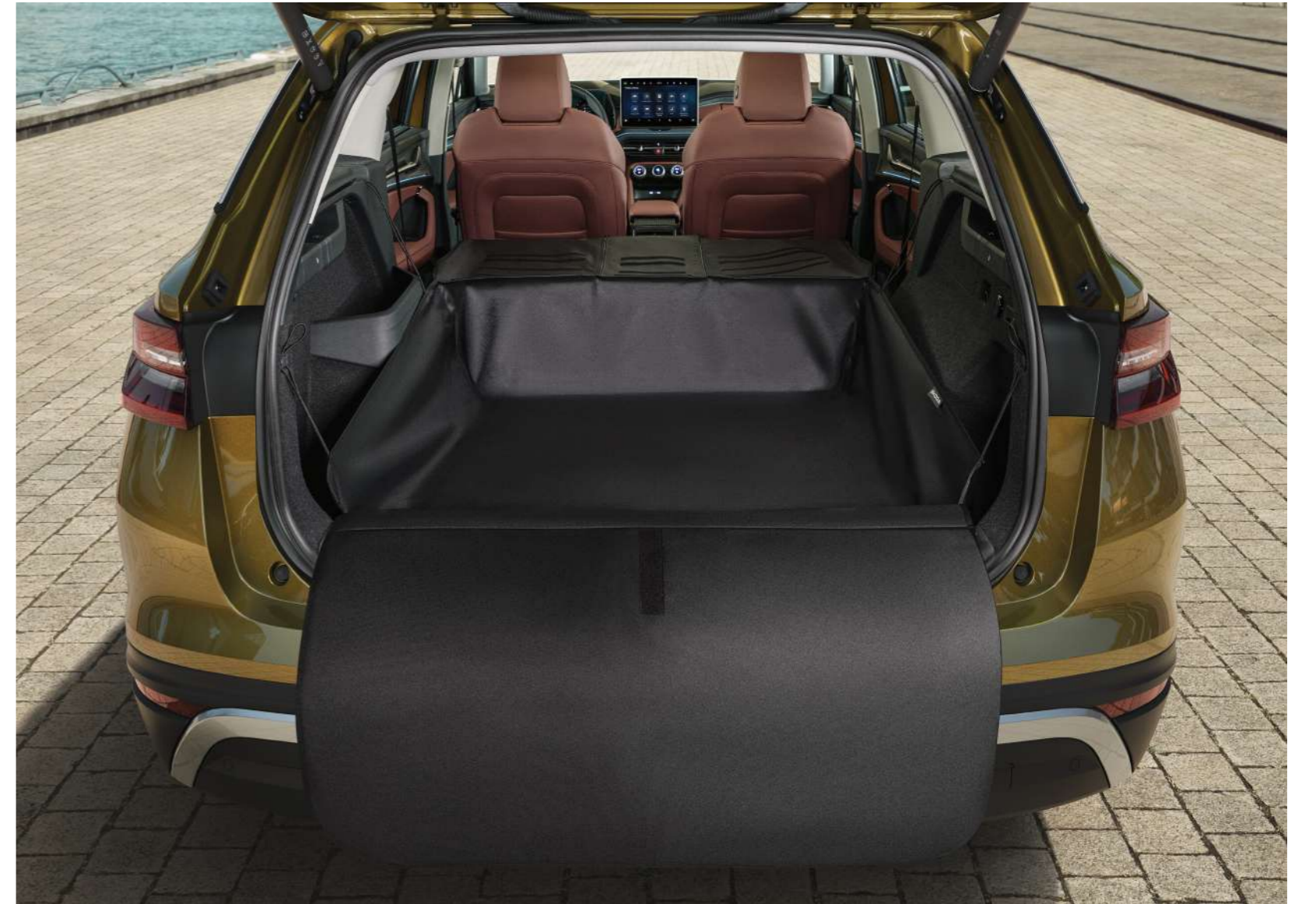
Dvipusis sulankstomas bagažinės kilimėlis