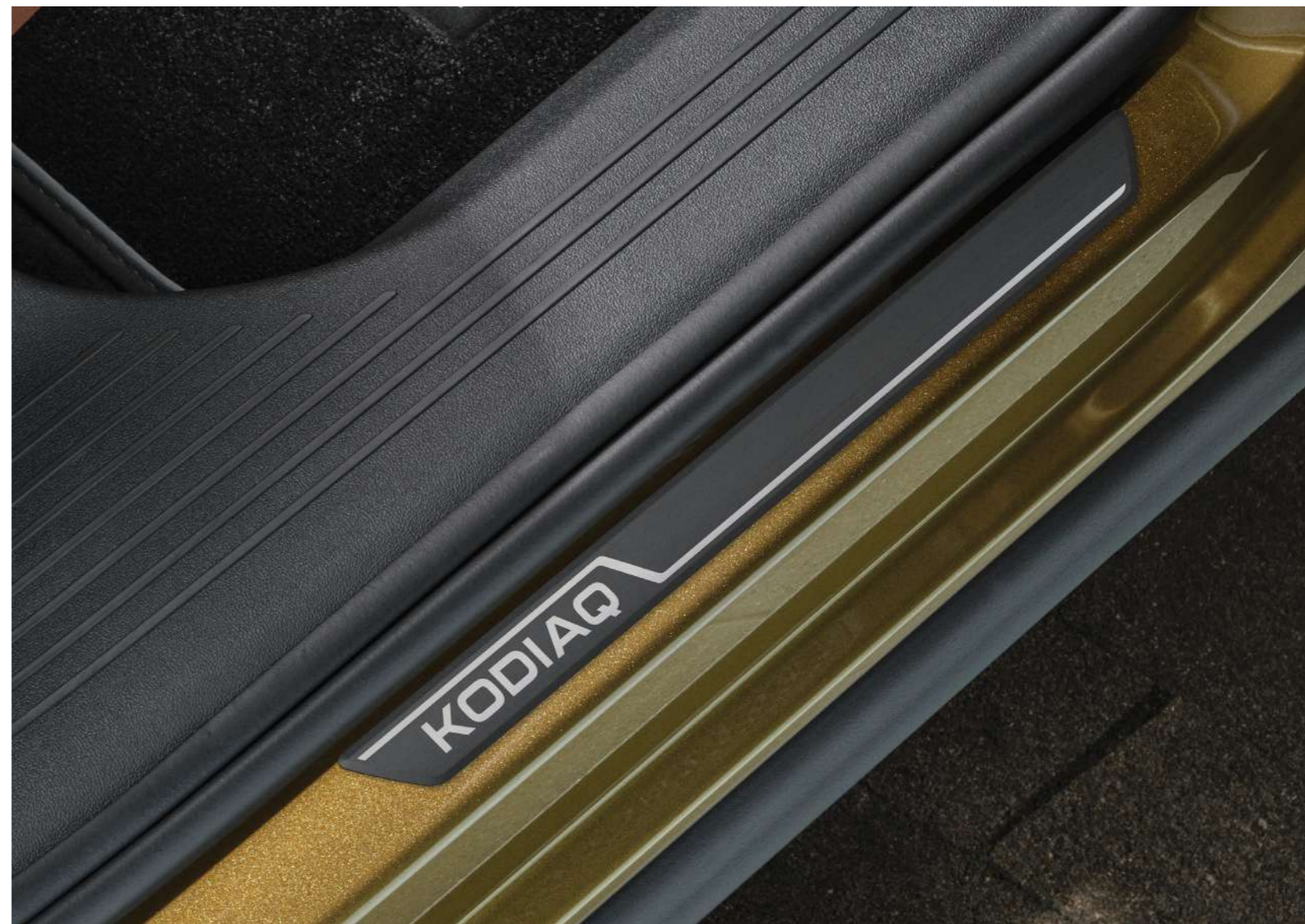
Dekoratyvines durų slenksčių juostos - galinės