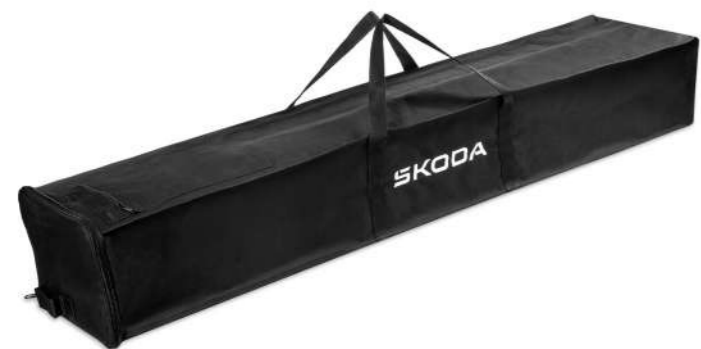
Stogo bagažinės krepšys