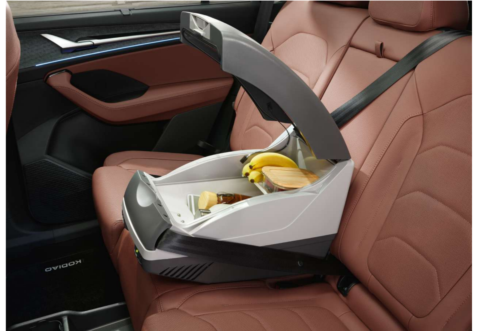
20 l termoizolacinė elektra šaldanti daiktadėžė