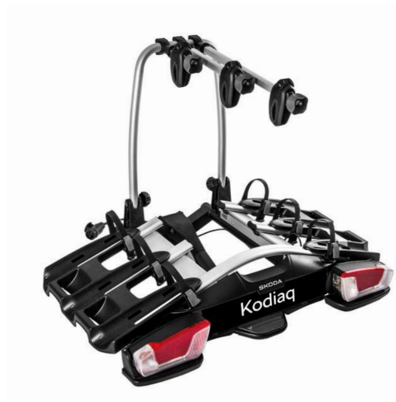
Dviračių laikiklis 3 dviračiams