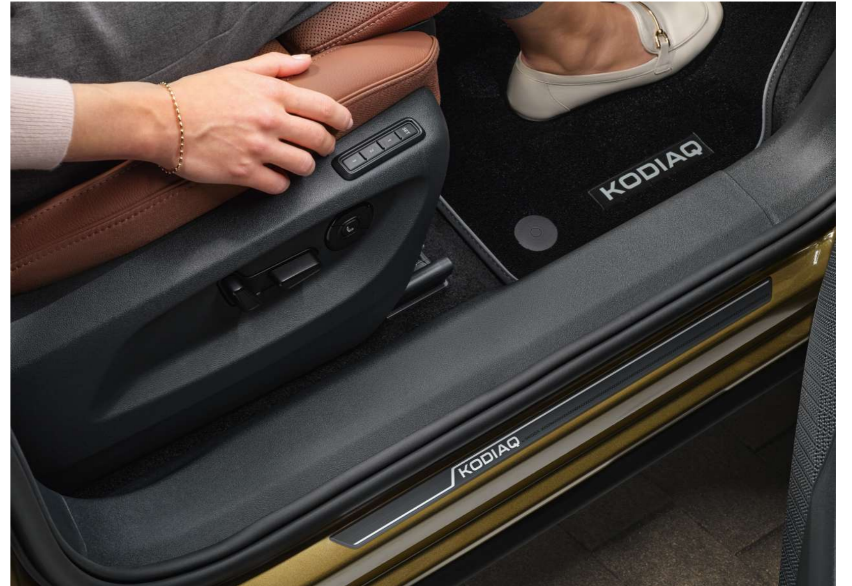
Dekoratyvines durų slenksčių juostos - priekinės