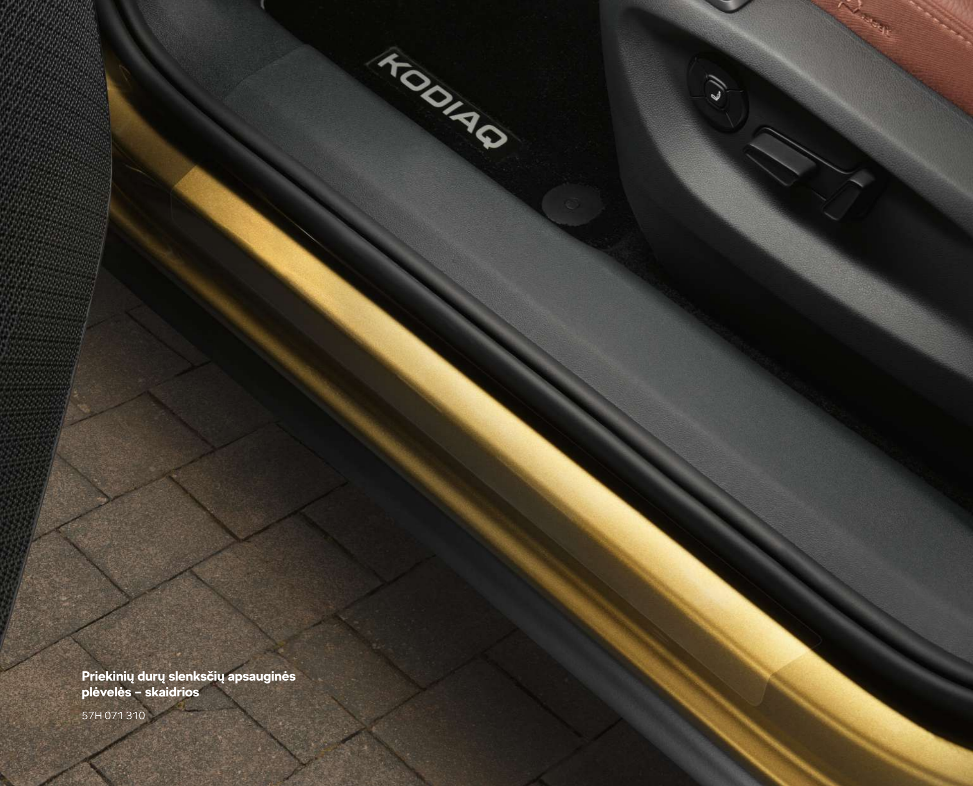
Priekinių durų slenksčių apsauginės plėvelės – skaidrios