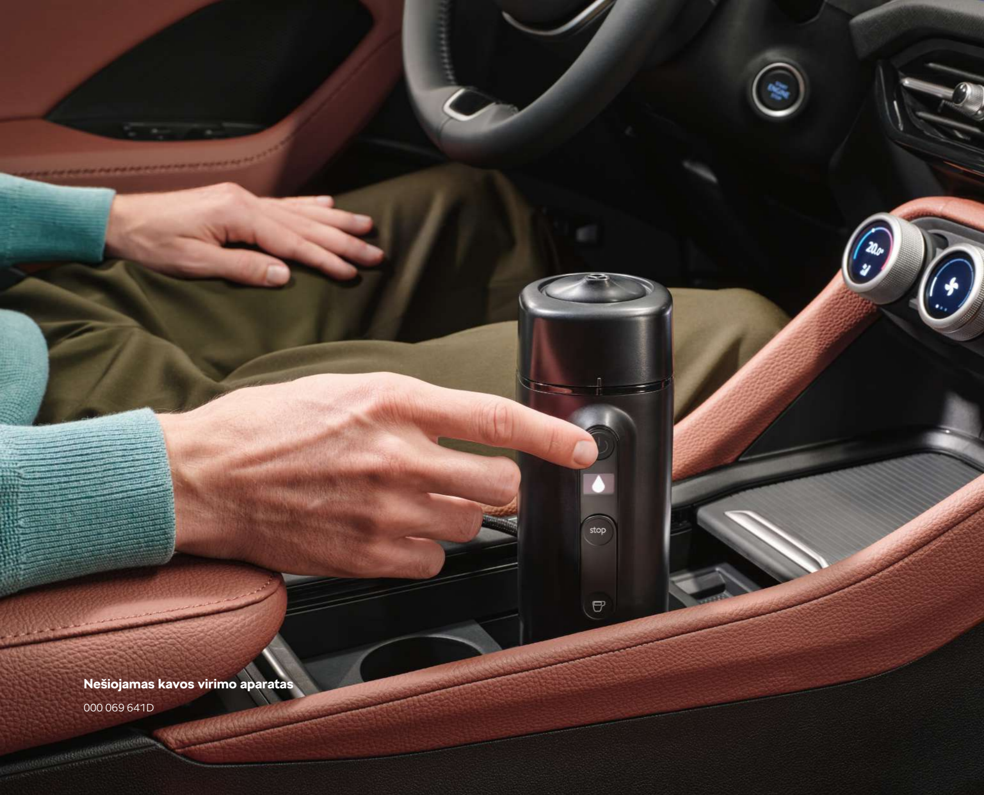
Nešiojamas kavos virimo aparatas