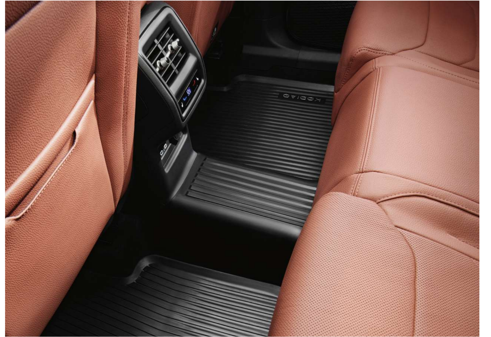
Koju atrama „Lounge Step“