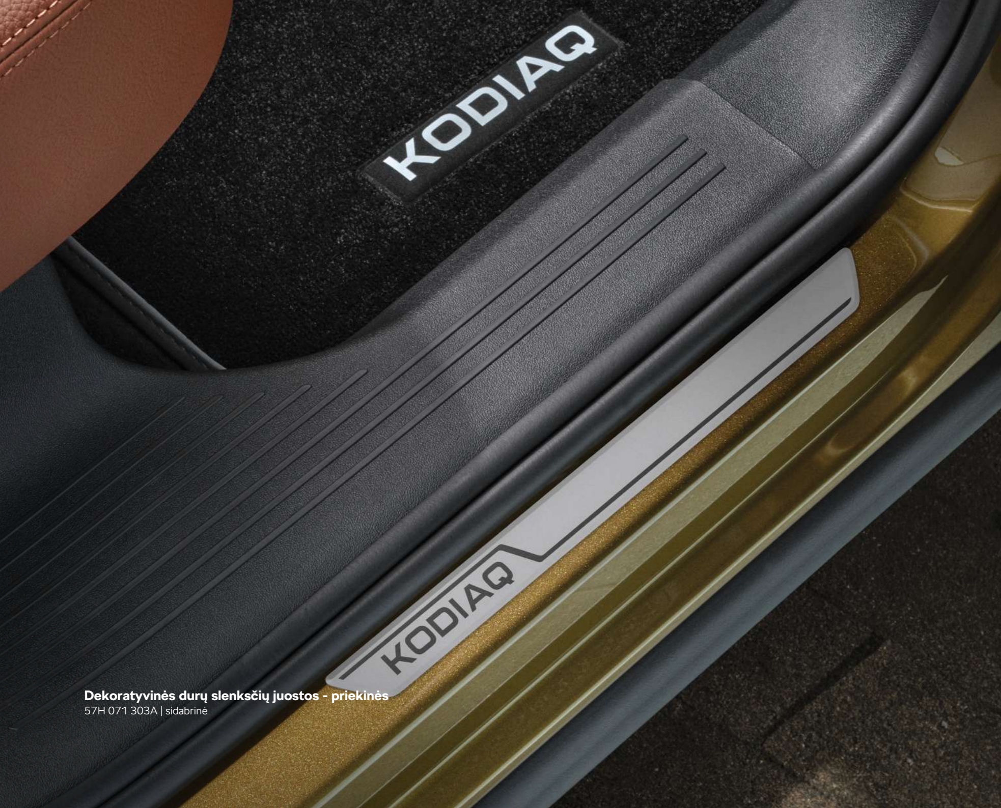
Dekoratyvines durų slenksčių juostos - priekinės 57H 071 303A | sidabrinė