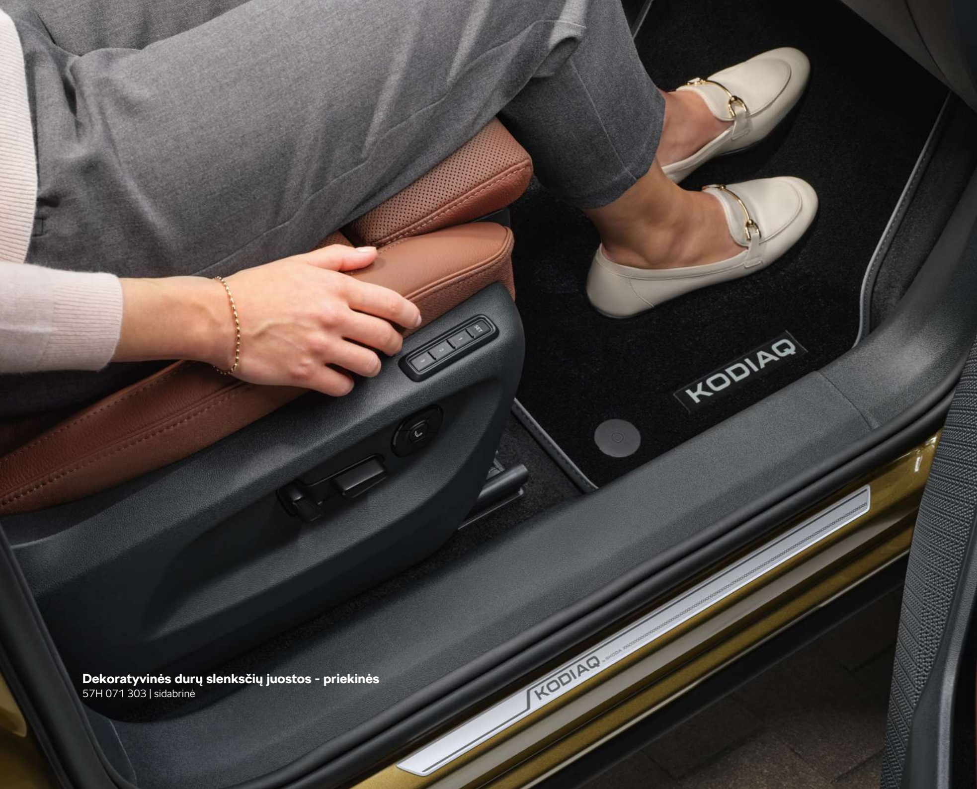
Dekoratyvines durų slenksčių juostos - priekinės 57H 071 303 | sidabrinė