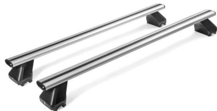
Skersinis stogo bagažinės laikiklis