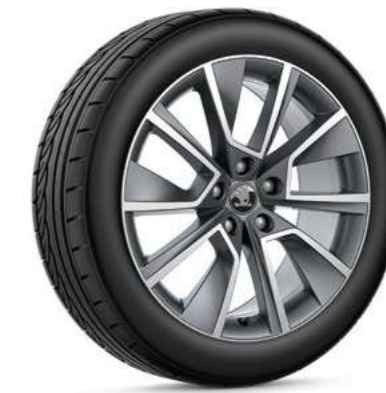
Braga lengvojo lydinio ratlankiai antracito spalvos, šlifuoti 7.5J x 18" ET48, skirti 225/45 R18 5E3 071 498M HA7 5E3 071 498AB HA7*