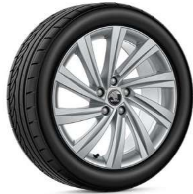
Perseus lengvojo lydinio ratlankiai sidabriniai metalizuoti, šlifuoti 7.5J x 18" ET48, skirti 225/45 R18 5E3 071 498G 8Z8 5E3 071 498AJ 8Z8*