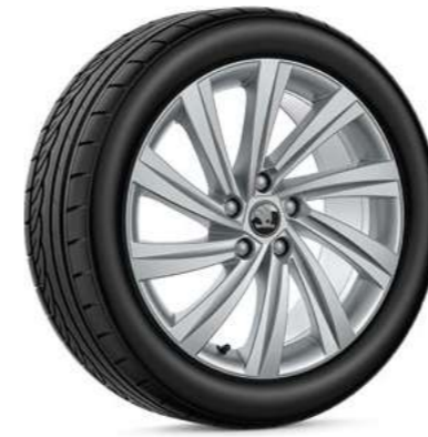
Perseus lengvojo lydinio ratlankiai sidabriniai metalizuoti 7.5J x 18" ET48, skirti 225/45 R18 5 E3 071 498N 8Z8 5E3 071 498AK 8Z8*