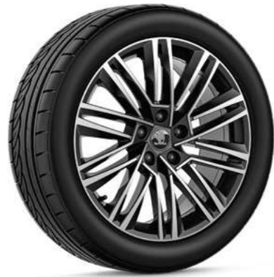
Luxon lengvojo lydinio ratlankiai juodi metalizuoti, šlifuoti 7.5J x 18" ET48, skirti 225/45 R18 5E3 071 498E FL8 5E3 071 498AG FL8*