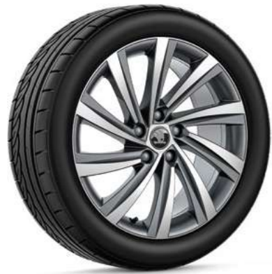
Perseus lengvojo lydinio ratlankiai antracito spalvos metalizuoti, šlifuoti 7.5J x 18" ET48, skirti 225/45 R18 5E3 071 498H HA7 5E3 071 498AL HA7*