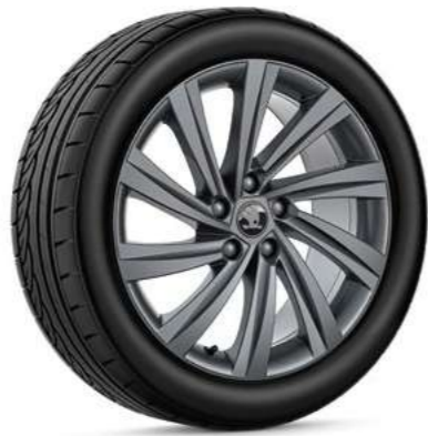
Perseus lengvojo lydinio ratlankiai antracito spalvos metalizuoti 7.5J x 18" ET48 for 225/45 R18 5E3 071 498P HA7 5E3 071 498AM HA7*