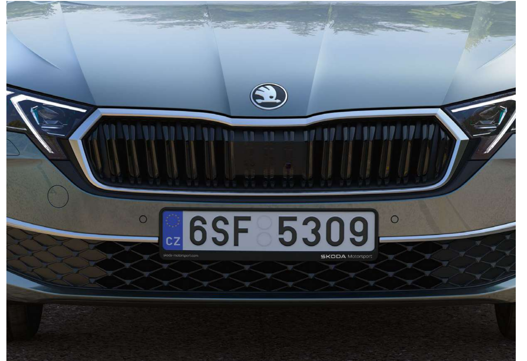
Valstybinio numerio rėmelis