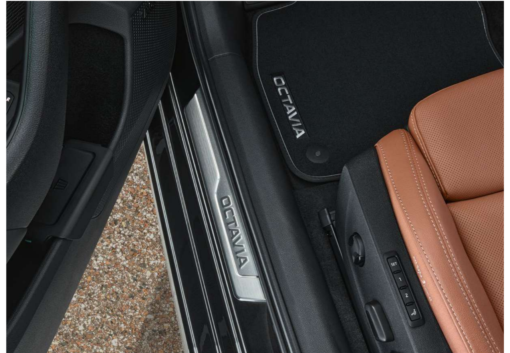
Dekoratyvines durų slenkščių juostelės - nerūdijantis plienas