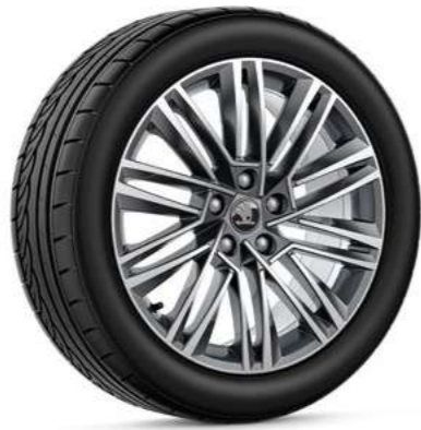
Luxon lengvojo lydinio ratlankiai antracito spalvos metalizuoti, šlifuoti 7.5J x 18" ET48, skirti 225/45 R18 5E3 071 498D HA7 5E3 071 498AH HA7*