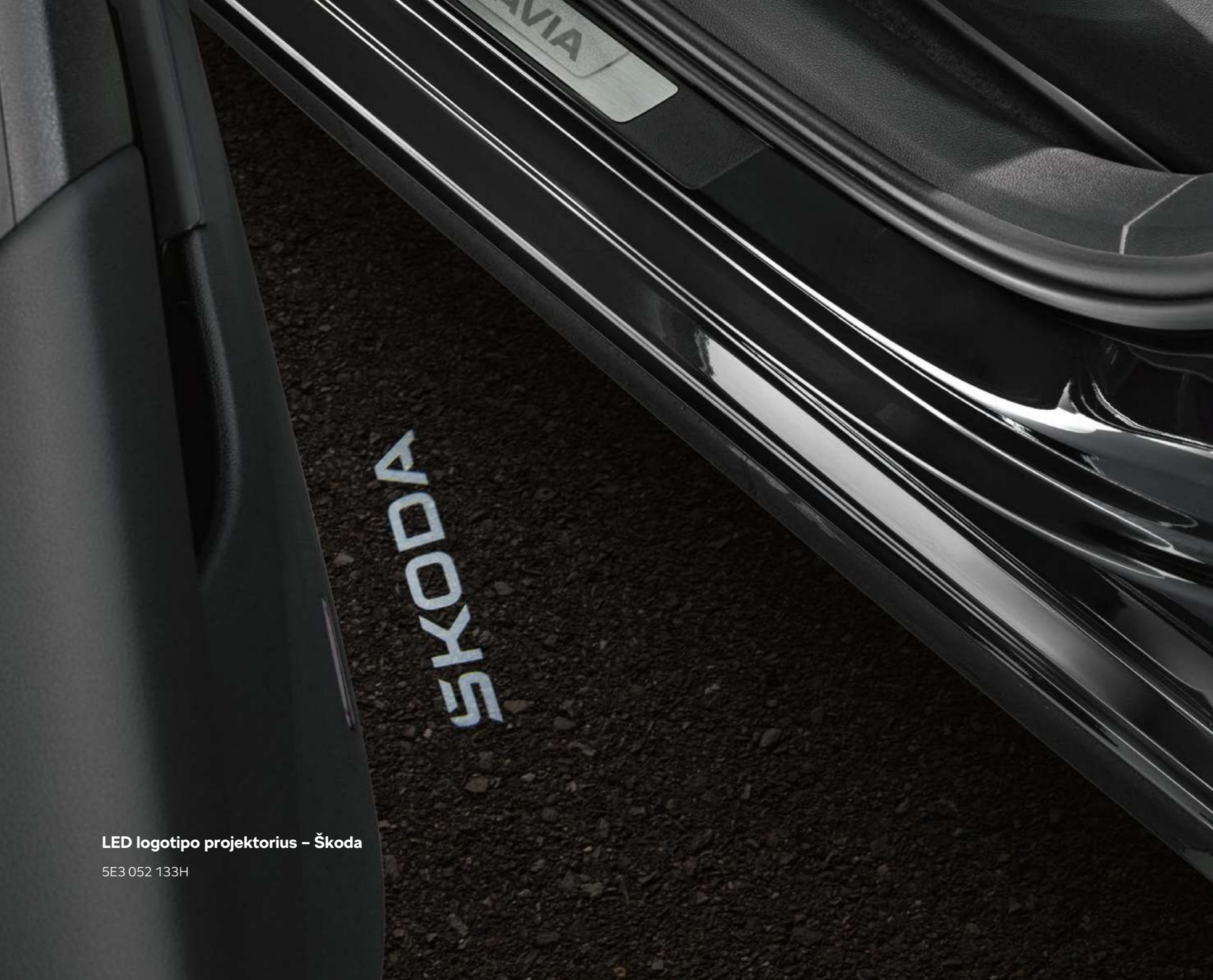
LED logotipo projektorius – Škoda