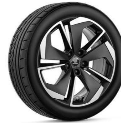
Comet lengvojo lydinio ratlankiai juodi metalizuoti, šlifuoti 7.5J x 18" ET48, skirti 225/45 R18 5E3 071 498 FL8 5E3 071 498AE FL8*