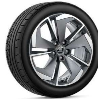
Comet lengvojo lydinio ratlankiai antracito spalvos metalizuoti, šlifuoti 7.5J x 18" ET48, skirti 225/45 R18 5E3 071 498A HA7 5E3 071 498AL HA7*