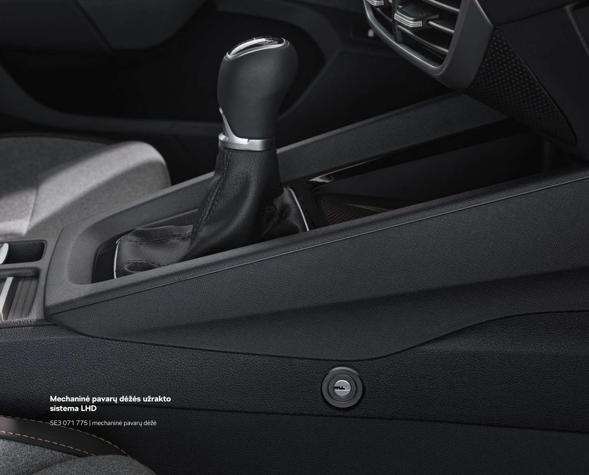
Mechaninė pavarų dėžės užrakto sistema LHD