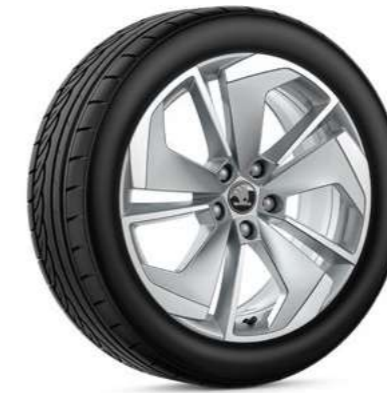
Comet lengvojo lydinio ratlankiai sidabriniai metalizuoti, šlifuoti 7.5J x 18" ET48, skirti 225/45 R18 5E3 071 498C 8Z8 5E3 071 498AJ 8Z8*