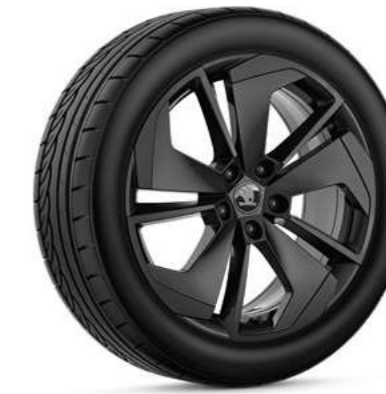
Comet lengvojo lydinio ratlankiai juodi metalizuoti 7.5J x 18" ET48, skirti 225/45 R18 5E3 071 498K FL8 5E3 071 498AF FL8*