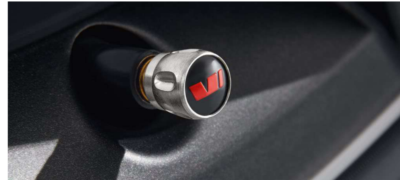
Dekoratyviniai ventilių dangteliai* su žaliomis RS emblemomis