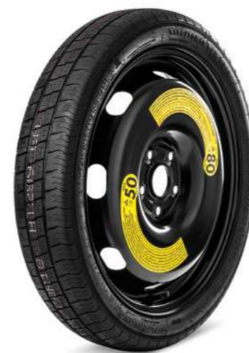
18" atsarginis ratas*

5E3 601 011L | 3.5J x 18" ET25.5 125/70 R18