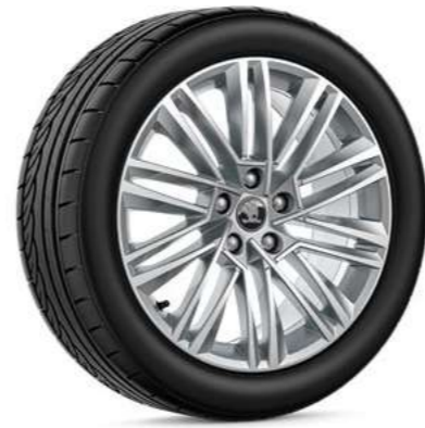
Luxon lengvojo lydinio ratlankiai sidabriniai metalizuoti, šlifuoti 7.5J x 18" ET48, skirti 225/45 R18 5E3 071 498B 8Z8 5E3 071 498AF 8Z8*